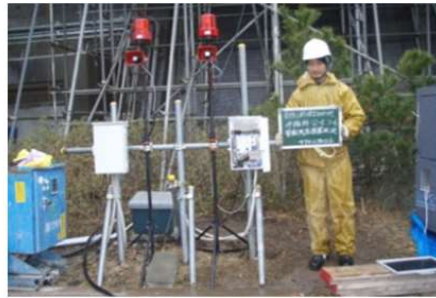
伸縮計設置・観測